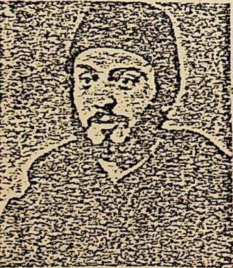
Sâmi Efendi'nin gençliği