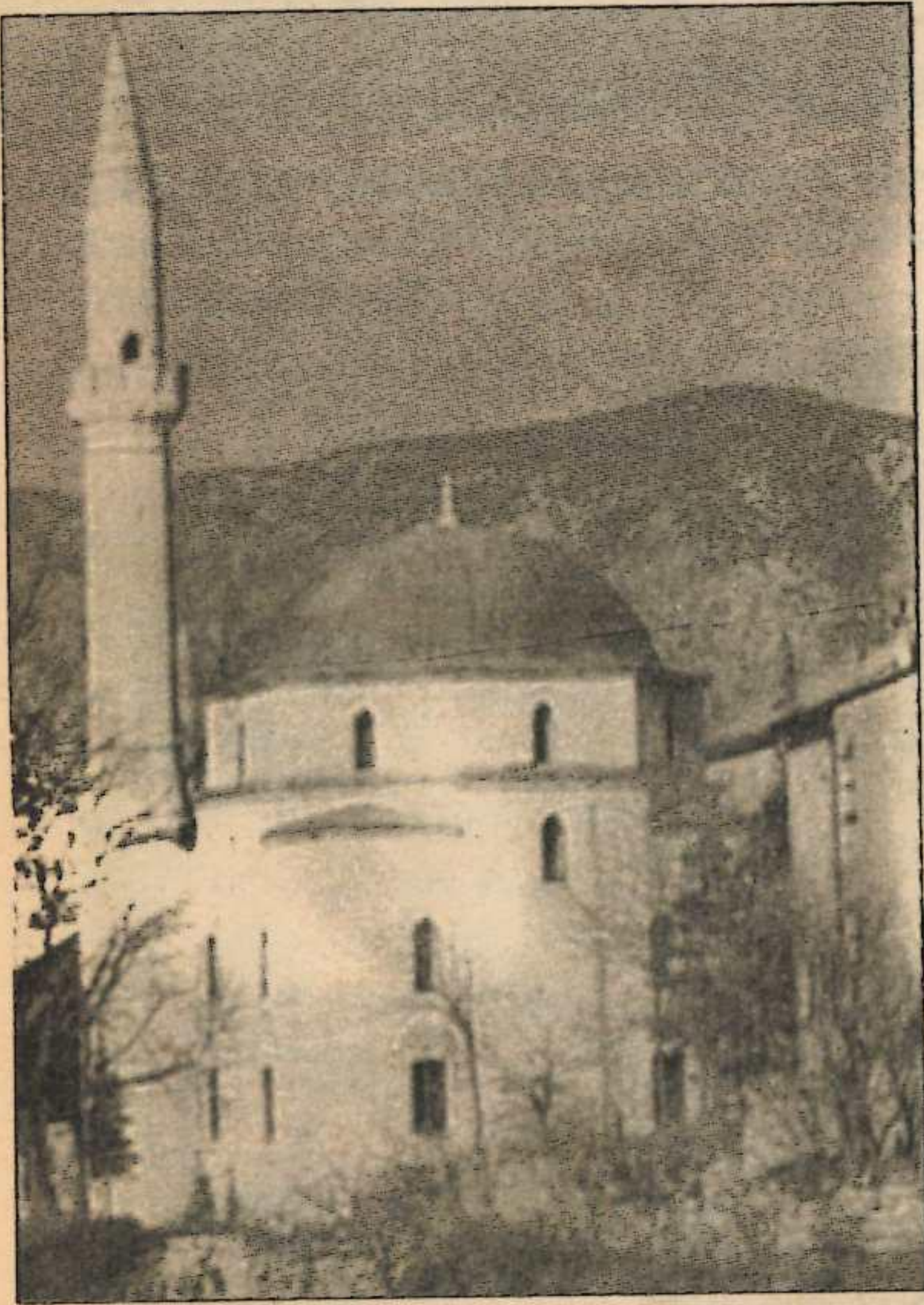
Koski Mehmet Paşa Camii'nin savaştan önceki ve sonraki hali.