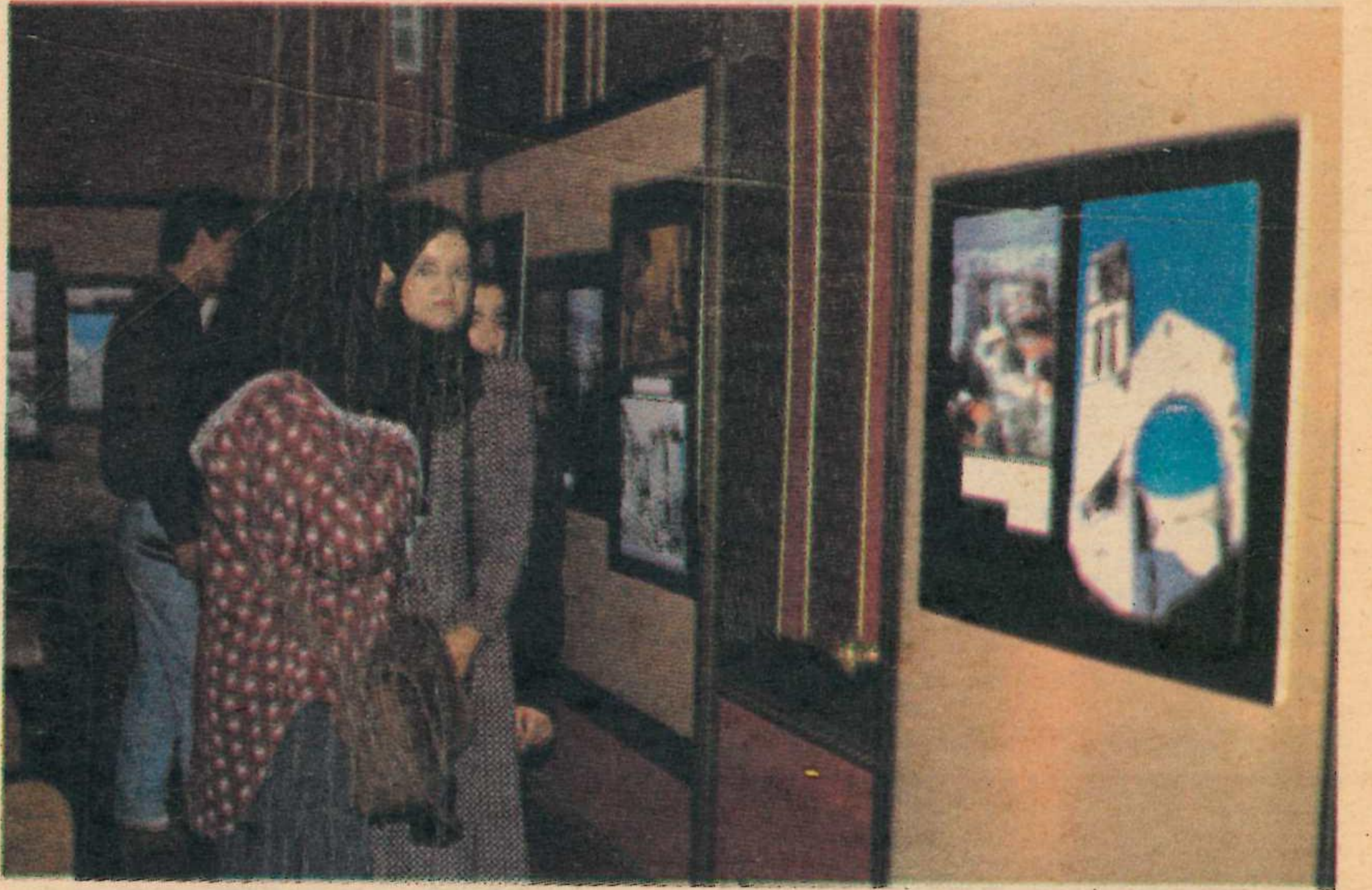
Yıldız Sarayı Çift Kasrı'nda açılan "Bosna-Hersek Fotoğrafları Sergisi" 18 Haziran tarihine kadar sürdü.

şanan olaylarla ilgili görüşlerini dile getiren Somun ayrıca buradaki katliama Sırp fanatiklerinin yanısıra Hırvatlar'ın da katıldığı ve Mostar'da çok büyük facialar yaşandığını ilave etti.