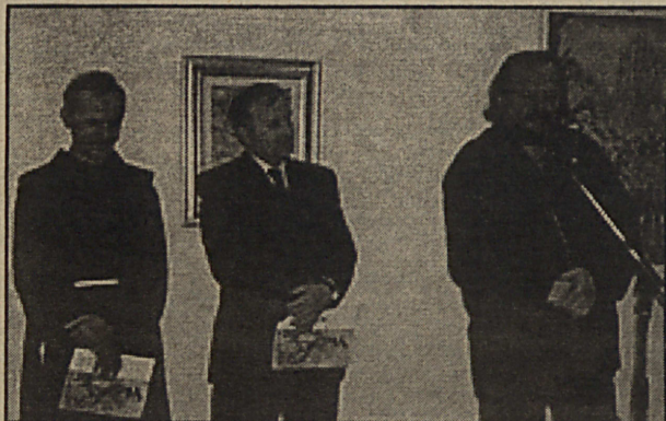
Sa otvaranja izložbe u Čitluku

O liku i djelu autora Švaljeka govorili su predsjednik