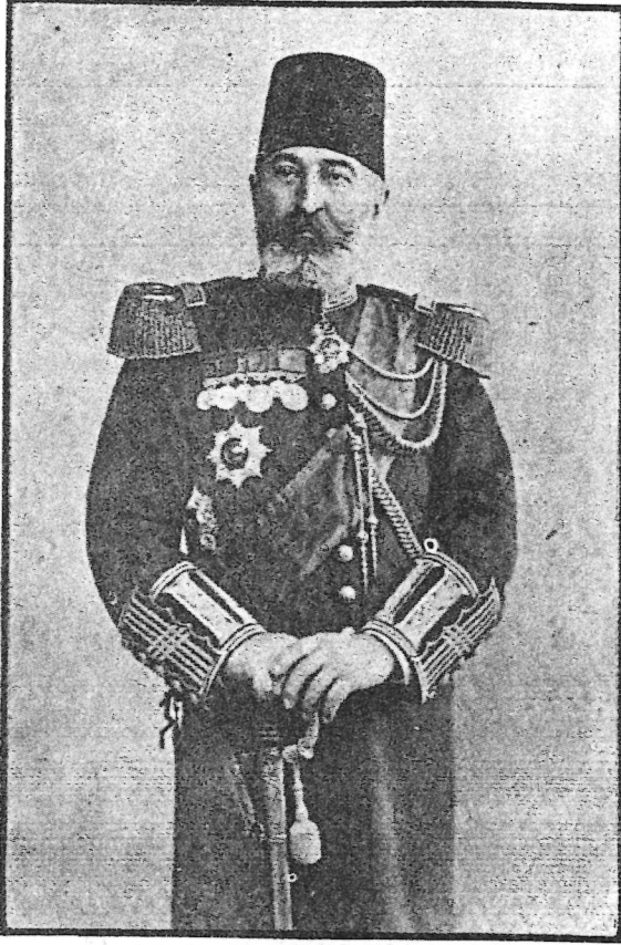
Müşir SADETTİN PAŞA

ğası olmadan, gösterdiği yararlılık ve başarı nedeniyle bir buçuk yılda yüzbaşılıktan yarbaylığa yükseldi. Muharebeden sonra Daire-i Umuru Askeriye (M.S.B.lığı) Muhasebat Dairesi Tahsilat Komisyonunda görevlendirildi. Gazi Osman Paşa (1832-1900) nın ser-askerliğinde albay ve mirlivalığa (generalliğe) yükseldiği gibi ser-asker müşir Rıza Paşa (1844-1920) nın önerisiyle de ferik oldu ve Babı-Valâyi Seraskeri (M.S.B.lığı) Muhasebat Dairesi birinci başkanlığına getirildi. Aynı zamanda Padişah yaverliğine alındı. Bir süre sonra birinci ferik (orgeneral) oldu. 1904'de ek görev alarak Askeri Emekli Sandığı Nazırlığına atandı. Şubat 1905'de müşirliğe yükseldi ve Masraf Nazırı oldu. Ayrıca Yıldız Sarayındaki Maiyeti Seniyye Erkanı Harbiyesinde görevlendirildi. Bu görevleri ölümüne kadar sürdürdü.