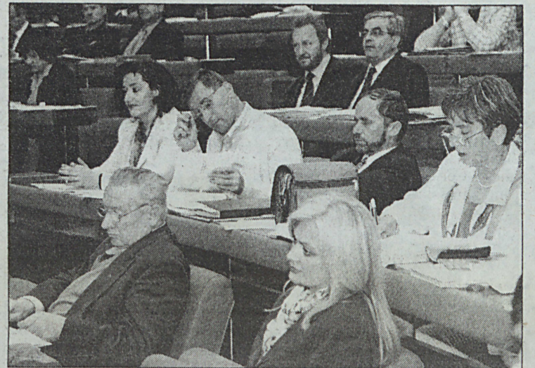
Predstavnički dom: Višesatna rasprava o izvještaju