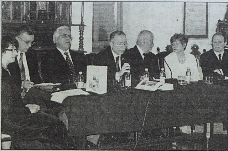
Sa promocije: Pokušaj da se naučno riješi problem osmanske države