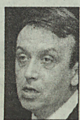
Terzić: Izvještaj dobio podršku

- BiH ima šansu da krajem maja dobije saglasnost za otpočinjanje pregovora, a da u kasnu jesen i započne pregovore o potpi-